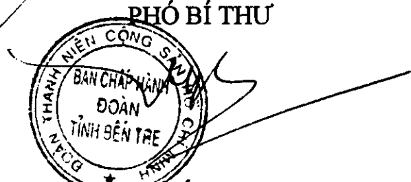
Hà Quốc Cường